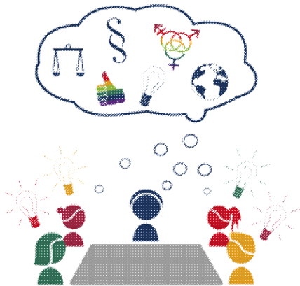
Diversity-Mainstreaming an der Hochschule

Über diese Entscheidung haben wir uns heute ganz besonders gefreut! Wir gratulieren der LGBTIQ*-Bewegung für diesen großen Erfolg, in einem langen Kampf um Anerkennung.