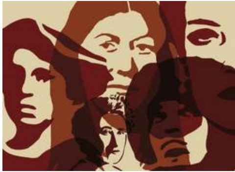
Revolutionäre Frauen, Edition Assemblage