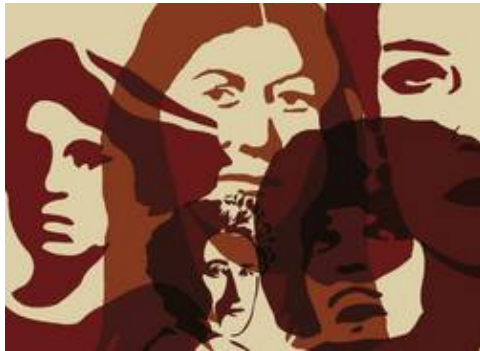
Revolutionäre Frauen, Edition Assemblage