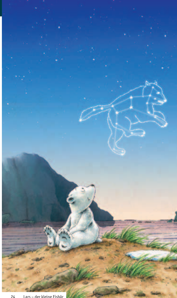
24 Lars – der kleine Eisbär

Veranstaltungen für Schulklassen und Kindergärten So nah kommen einem die unendlichen Weiten selten: Unter der Kuppel des Mediendoms erleben Kinder aus Schulen und Kindergärten nach Voranmeldung die geheimnisvolle Welt der Wissenschaft. Multimedialer Anteil: ●●○○, 4,- € bis 5,- € (2 Begleitpersonen frei)