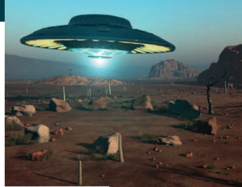
04 Ferne Welten – fremdes Leben?

Für die Raumfahrtbehörde ESA entstand am Mediendom diese Produktion zur Geschichte der Weltraumforschung. In einer Mischung aus Realfilm und Computeranima-tion sind die Besucher unter der 360°-Kuppel praktisch direkt dabei, wenn Galileo Galilei mit seinem Fernrohr das All erkundet und 400 Jahre später donnernd die Ariane-5-Rake-te startet, die „Herschel“ und „Planck“ in den Weltraum bringt: Weltraumteleskope, die Blicke zurück bis zur Geburt des Universums ermöglichen. Audiodeskription für Blinde und Sehbehinderte erhältlich. Multimedialer Anteil: ●●●●, ab 10 Jahren, 8,- € (6,50 €)