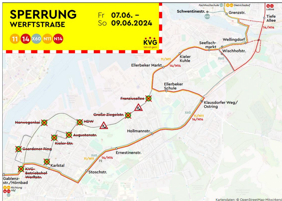
Abbildung 2 Umleitungskarte der KVG

Mehr Informationen: https://www.kvg-kiel.de/fuer-unsere-fahrgaeste/verkehrsmeldungen/werftstrasse-in-hoehe-grosse-ziegelstrasse-ab-07-09-2024