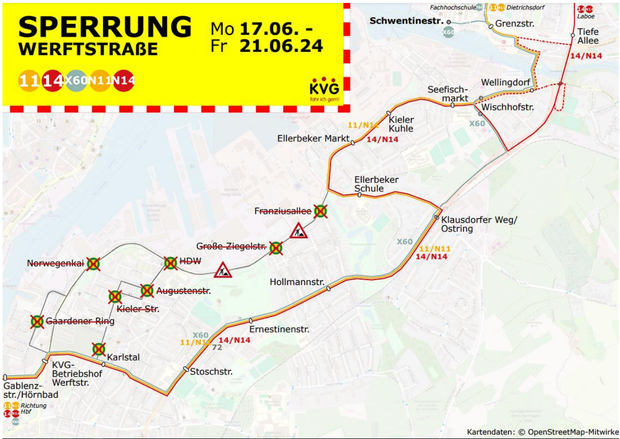
Abbildung 2 Umleitungskarte der KVG